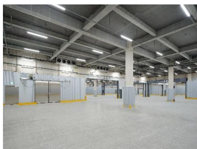
▲2 階 定温倉庫内部

1 階にはリボリューションファンを 2 基設置し、空間全体に大きな気流を作り、結露の抑制や気流感による就業者の夏季の体感温度の低減に寄与します。また、1 階および 4 階には泡消火設備を導入し、指定可燃物の保管にも対応可能です。2 階・3 階は定温倉庫の仕様となっており、2 階は 10°C 帯、3 階は 20°C 帯での運用が可能です。