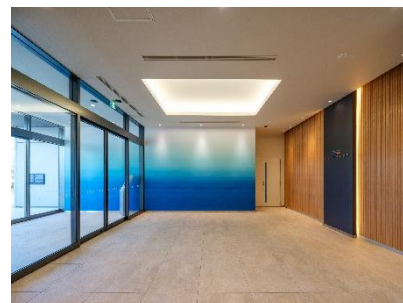
▲エントランスホール