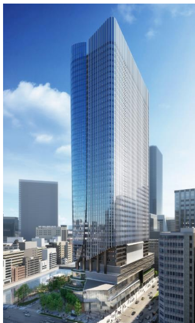
基本設計者：株式会社日本設計